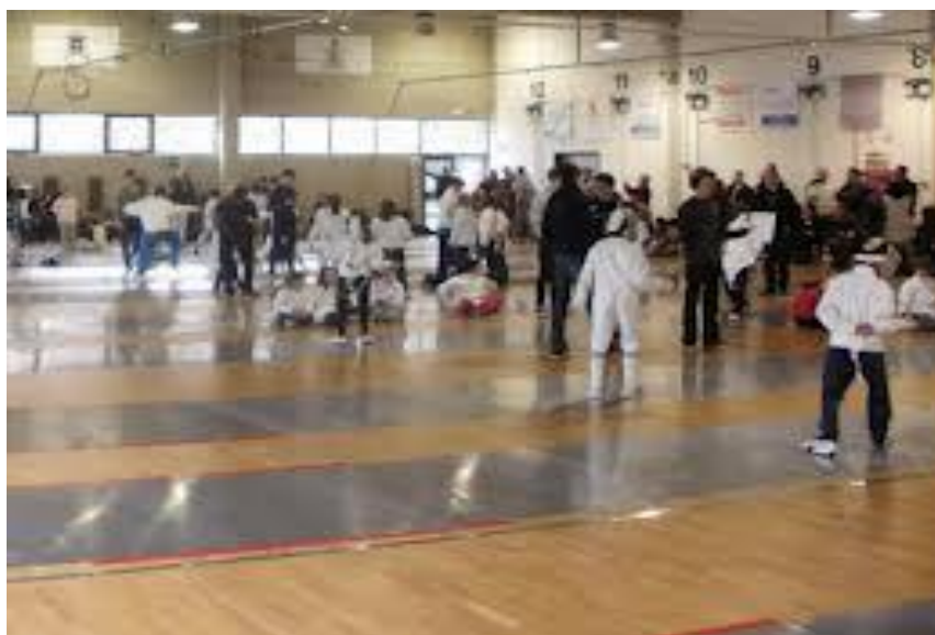
Imagen del momento que da comienzo a una competición de niños de esgrima disputada durante esta temporada.

2 vestuarios: Masculino y Femenino específicos para la esgrima..