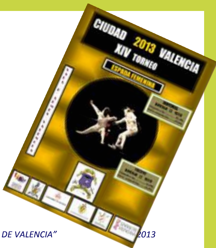
CARTEL TNR "CIUDAD DE VALENCIA" 2013