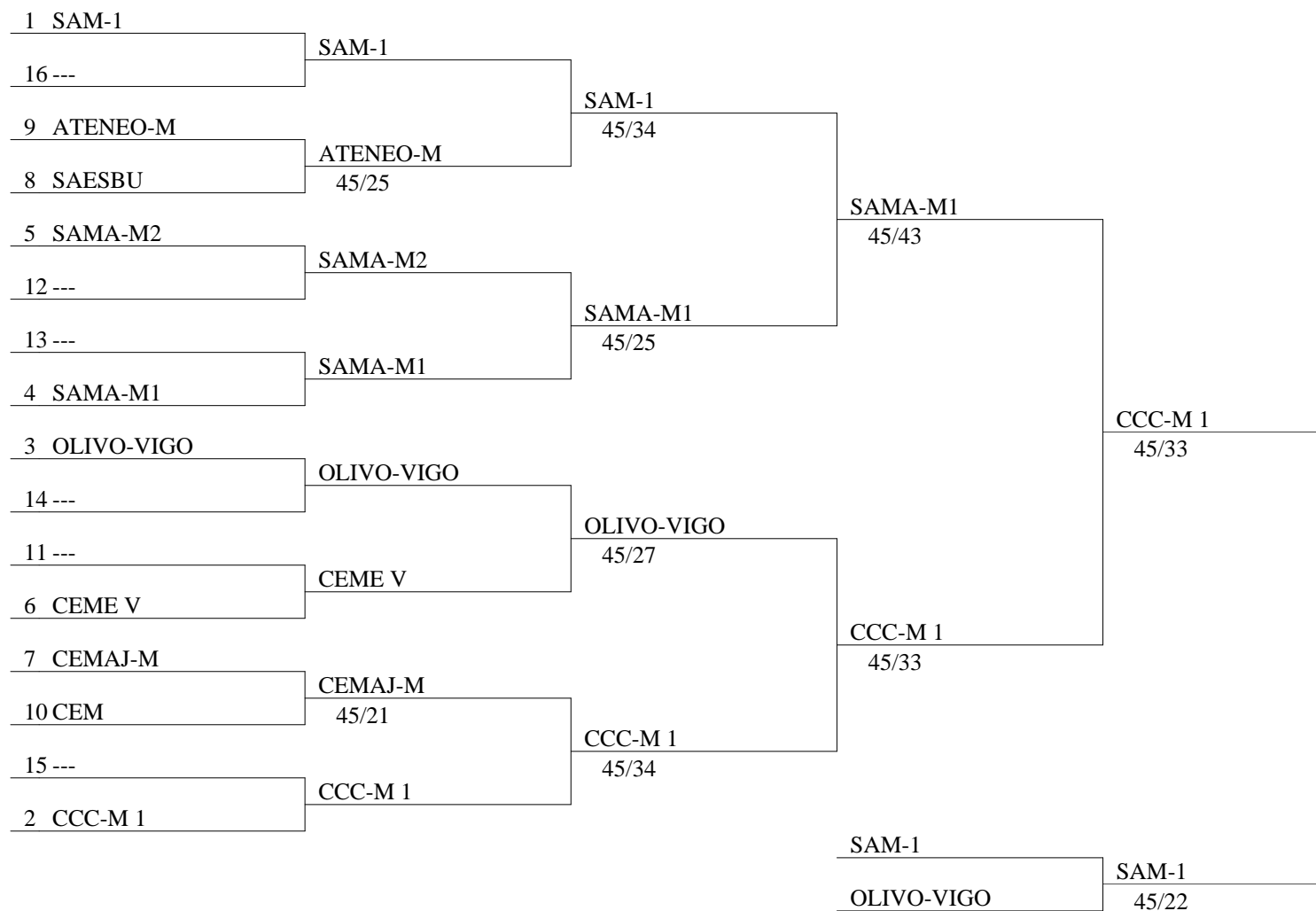
Tableau de 16